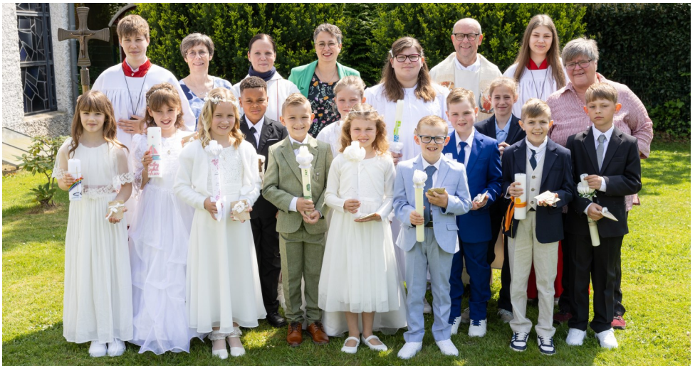
Die Erstkommunionkinder von St. Laurentius 2026

Am Sonntag, 10.05.26 feierten 13 Mädchen und Jungen in der St. Laurentius-Kirche ihre Erstkommunion. Ein halbes Jahr hatten sich die Kinder und ihre Eltern an Projekttagen und in Gruppenstunden auf diesen Tag vorbereitet. Der Gottesdienst stand unter der Zusage Jesu: „Ihr seid meine