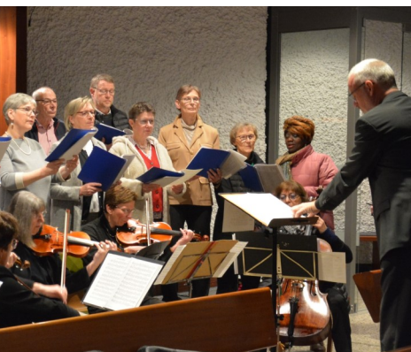
Sinfonieorchesters Lübbecke