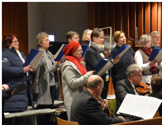
Der Kirchenchor St. Laurentius mit Mitgliedern des S