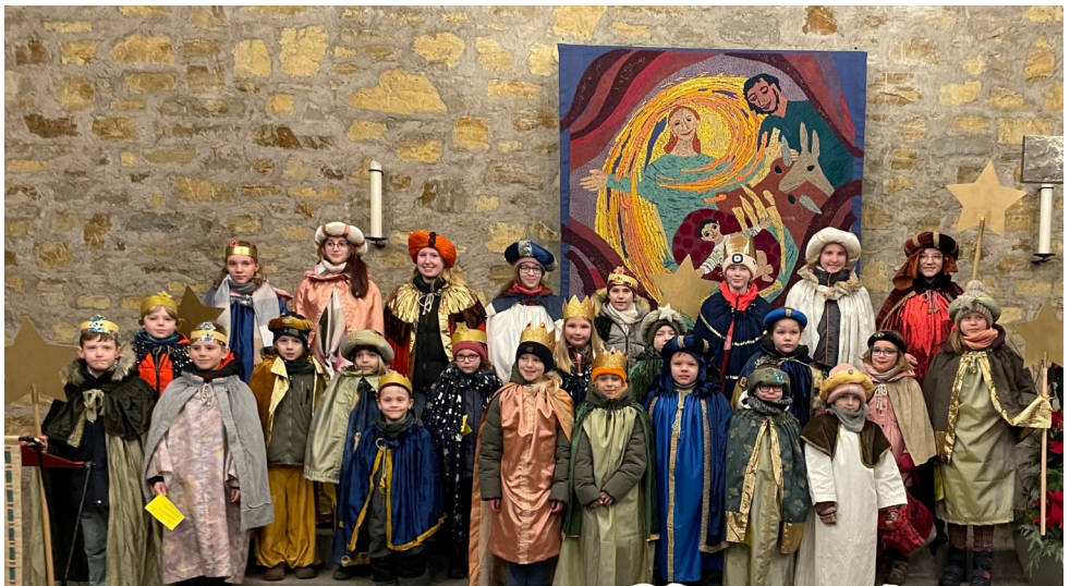
Die Sternsinger von St. Walburga