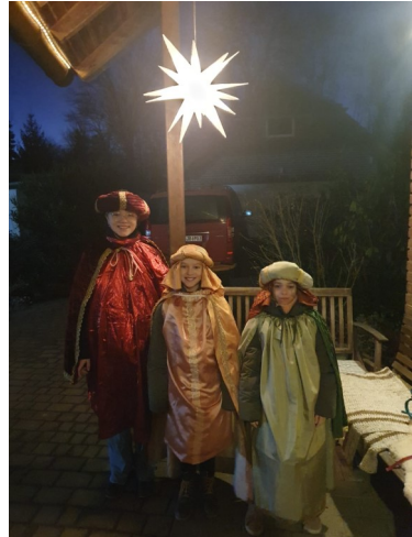
Auftakt Sternsingerfahrt nach Paderborn

Auch in Porta Westfalica beteiligten sich 27 Kinder und Jugendliche mit ihren erwachsenen Begleitern an der diesjährigen Sternsingeraktion und erhoben ihre Stimme für Kinderrechte. In einem Vorbereitungstreffen setzten sie sich mit dem Thema Kinderrechte auseinander. Motiviert zogen sie am 4. Januar los, um den Segen in die Häuser zu bringen und um Spenden zu sammeln, damit auch in ärmeren Ländern Kinder zu ihren Rechten kommen. So brachten sie nicht nur den Segen, sondern wurden selbst zum Segen für ihre Altersgenossen.