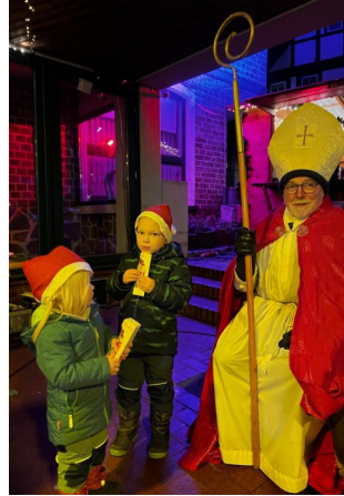
Der Nikolaus war in Hausberge (Foto privat).

Der Nikolaus kam am 6. Dezember pünktlich 17:00 Uhr an die Hausberger Hütte in Porta Westfalica. Mit Liedern und Dias, die aus dem Leben des Heiligen Nikolaus erzählen, verbrachten die Familien und der Nikolaus eine schöne Zeit.