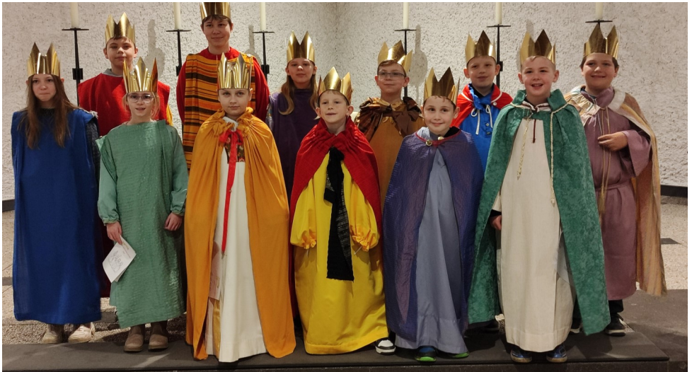
Die Sternsinger von St.Laurentius

Ein Festgottesdienst in unserer St. Laurentius-Gemeinde mit anschlie-