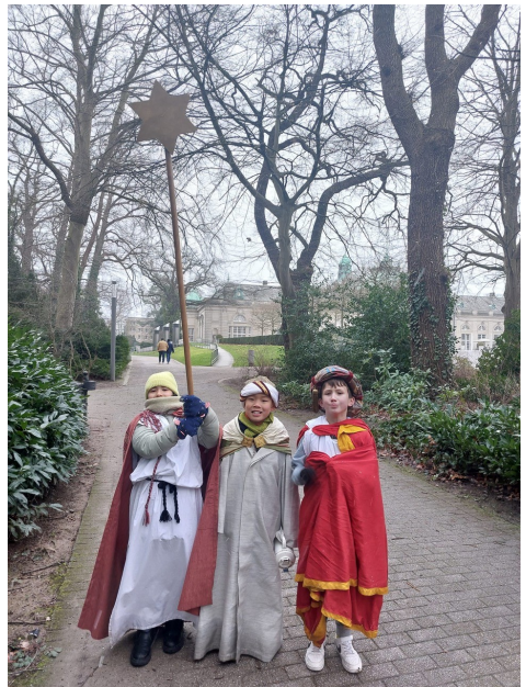
Die Sternsinger im Kurpark Bad Oeynhausen