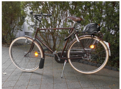
Wer möchte, kann mit dem Fahrrad die kirchenverbindende Tour machen

Es wird Speisen und Getränke geben und wer möchte und kann, darf radeln, wer mit dem Auto fahren möchte, ist auch herzlich eingeladen.