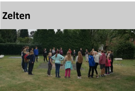
Gemeinsam wurde die Zeit beim Zeltlager verbracht.