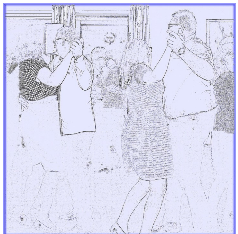
Tanz mal wieder in Löhne.