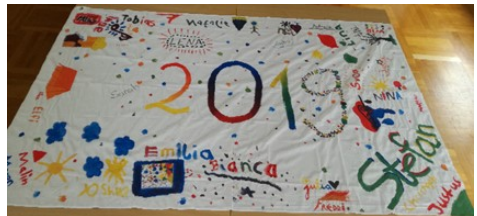
Das gestaltete Bettlaken 2019

Nach dem Essen wurde das Gebiet rund um die Kirche und dem HdB zur „elternfreien Zone“ erklärt, in der viel gespielt, gebastelt und ein cooles Bettlaken gestaltet wurde.