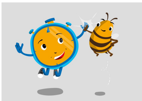
Die Maskottchen der Aktion Stoppi und Sabine

Vortreffen für alle Teilnehmenden der 72-Stunden-Aktion am Freitag, 17. Mai 2019 um 19 Uhr in St. Walburga.