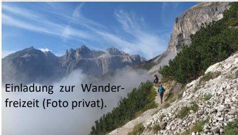
Einladung zur Wanderfreizeit.