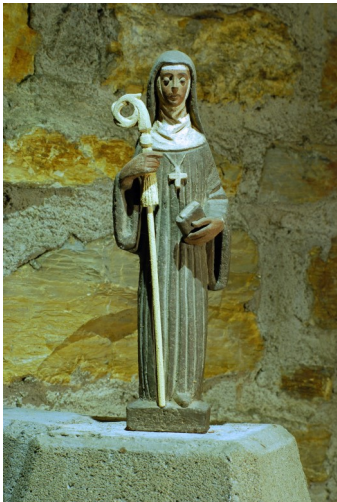
Statue der Heiligen Walburg in der Kirche St. Walburga, Porta Westfalica.

Anschließend wird zu einem Empfang und einem Vortrag mit Pastor Richardt zum Thema „Liturgische Kleidung“ eingeladen.