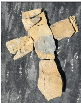
Das kleine Kreuz aus Steinen der Walburga-Kirche.