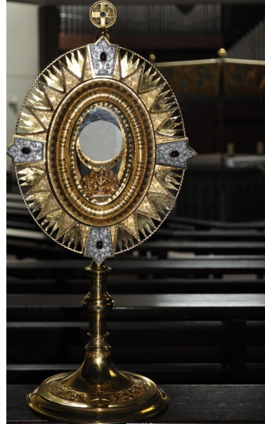
Die Monstranz von St. Peter und Paul, Bad Oeynhausen