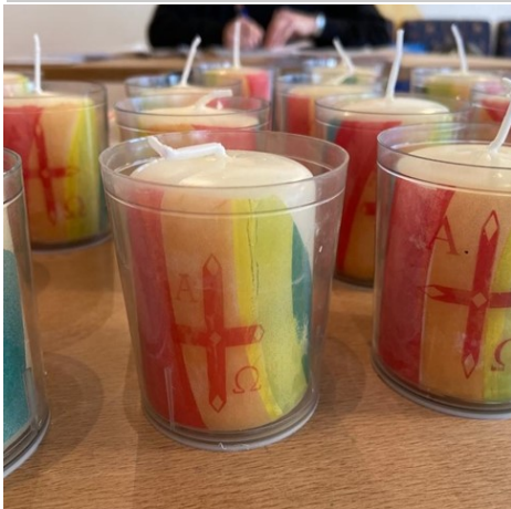
Selbstgebastelte Kerzen für die FirmbewerberInnen als Nikolausgeschenk

Am 05. Dezember 2020 trafen sich einige der diesjährigen Firmkatecheten aus Vlotho und Löhne im Haus der Begegnung in Löhne, um eine Kleinigkeit für die Firmbewerber zu basteln. Aufgrund der Corona-Pandemie und den daraus resultierenden Auflagen waren Präsenzveranstaltungen mit den Firmbewerbern seit November nicht mehr möglich.