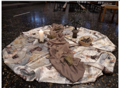
Der vorbereitete Weg für das Kreuz

Mit dem Gedanken, im Kreuz ist Heil und Erlösung, wollen wir in diesem Jahr in St. Johannes Ev. durch die Fastenzeit gehen. Unsere Gottesdienstbesucher haben die Möglichkeit, auf dem vorbereiteten Weg symbolisch für eine Fürbitte ein kleines Kreuz zu legen.