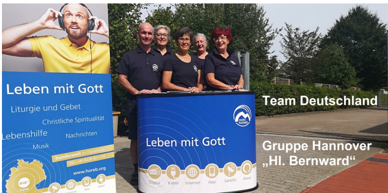
Das Team „Hannover“ von Radio Horeb

Mit Gott im Geschäft – so steuern zwei Jungunternehmerinnen ihre Modeboutique durch die Wirtschaftskrise.