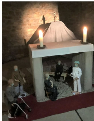
Aufgebaute Szene in St. Walburg