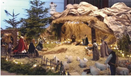
St. Peter und Paul, Bad Oeynhausen

INFORMATIONEN AUS DEM PASTORALEN RAUM WERREWESER