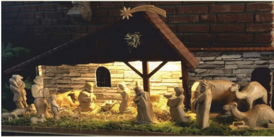
St. Hedwig, Exter