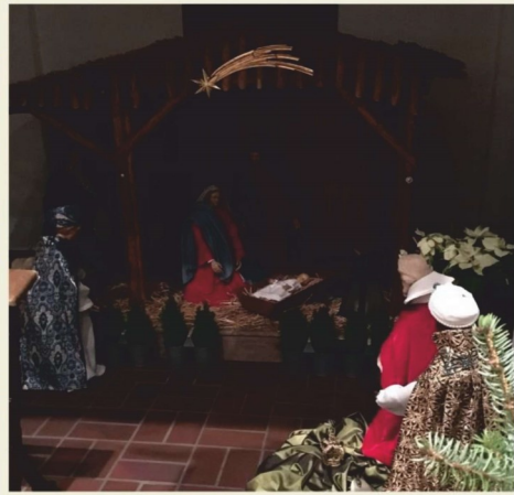
Heilig Kreuz, Vlotho