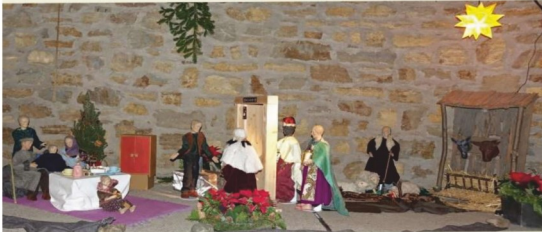
St. Walburga, Porta Westfalica