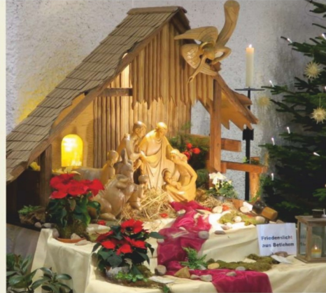
St. Laurentius, Löhne