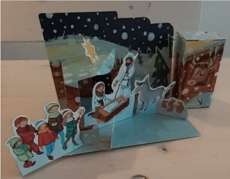
Das Spendenkästchen 2020/2021 (Foto privat).

„Kinder helfen Kindern – und ich bin dabei!“ lautet das Motto des Weltmissionstags der Kinder.