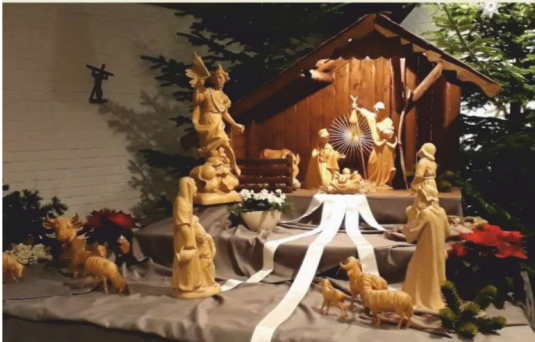
St. Johannes Ev., Eidinghausen