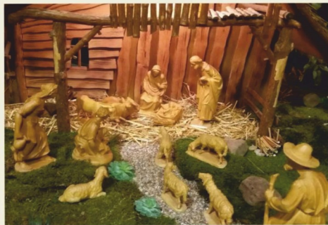
Markuskapelle, Gohfeld Seniorenzentrum

Weihnachten 2019 im Pastoralen Raum Werreweser