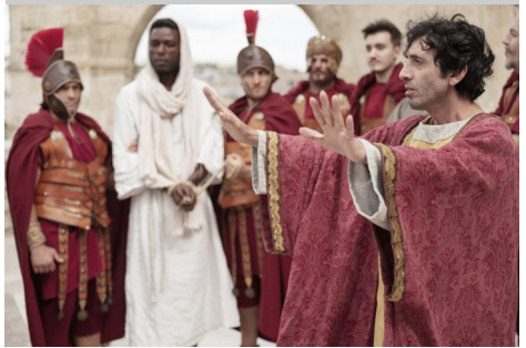
Foto aus dem Film „Das neue Evangelium“