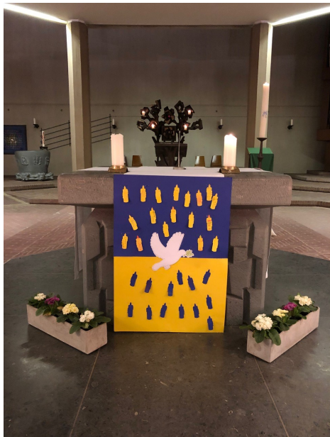
Altar in St. Peter und Paul mit einem Friedensplakat für die Ukraine.

Bis Palmsonntag (10.04.22) findet sonntagabends um 18 Uhr in St. Peter und Paul, Bad Oeynhausen ein Friedensgebet statt.