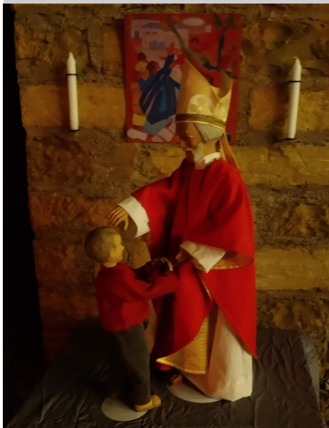
Installation „Zeichen der Hoffnung“, entwickelt von den Jugendlichen in St. Walburga